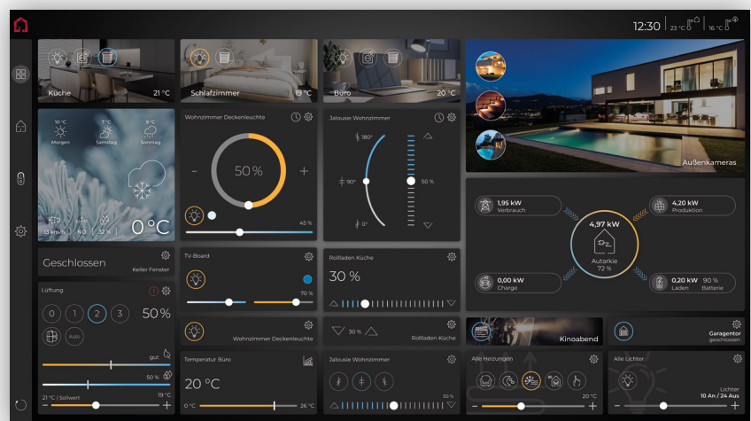
YOUVI - Controlpro