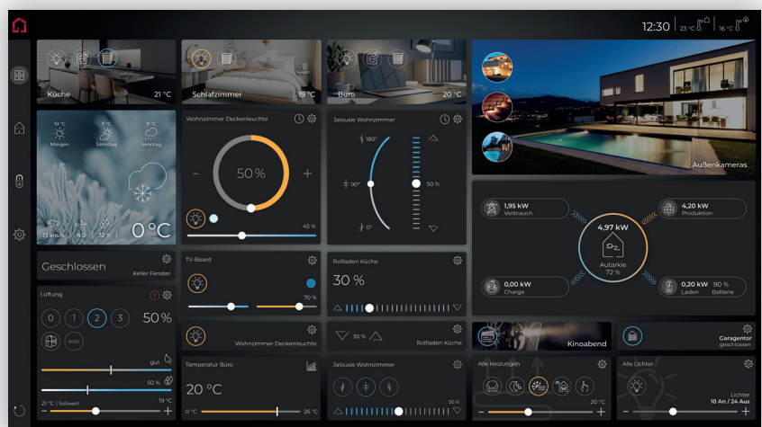
YOUVI - Controlpro